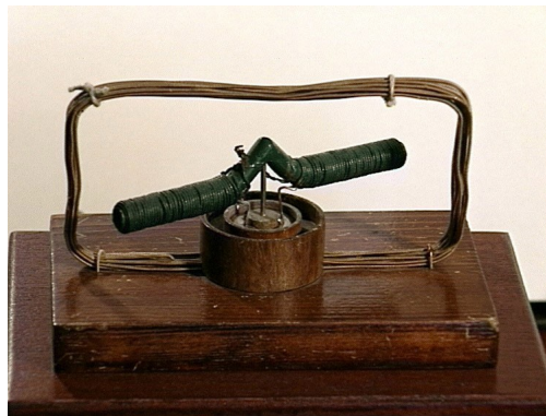
Jedlik Ányos forgonya

Ezért tekintették fontosnak, hogy a színvonalas oktatás érdekében a bencés szerzetesek a tudományok magas szintű művelői legyenek. A bencés gimnázium tanárai a szó legszorosabb értelmében tudós tanárok voltak, akik szakterületük kiváló művelői, kutatói voltak. Ennek, az egyrészt hagyományokon nyugvó, másrészt azonban az újat kereső oktatásnak részesei voltak, többek között: Kisfaludy Sándor és Károly , Reguly Antal , Deák Ferenc , gróf Batthyány Lajos , Xantus János , Petz Lajos , olyan tanárok mellett, mint Czuczor Gergely , Rónay Jácint , Rómer Flóris , Vaszary Kolos és nem utolsósorban Jedlik Ányos .