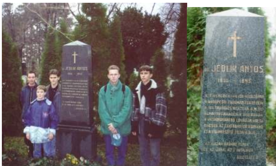
Jedlik Ányos síremléke és sírfelirata