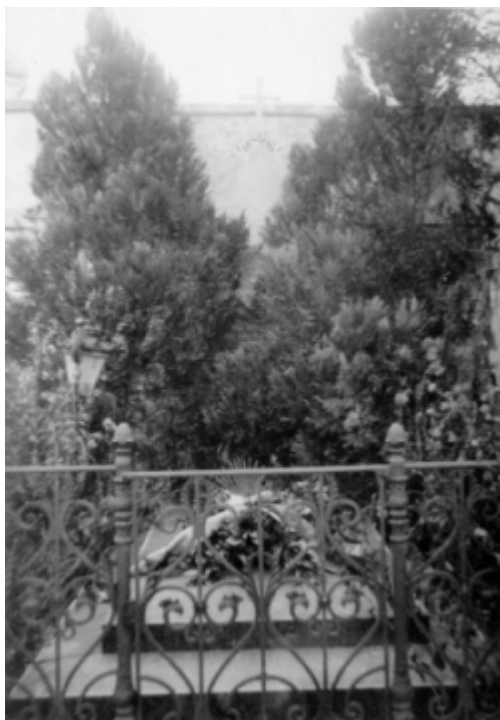
A bencés kripa, ahova Jedlik Ányost temették.

A halottat a régi, úgynevezett belvárosi temető bencés kriptájában helyezték "örök nyugalomra". Idézőjelbe tettem az örök nyugalom szó szerkezetet, hiszen nem a belvárosi temető lett Jedlik Ányos végső nyughelye.